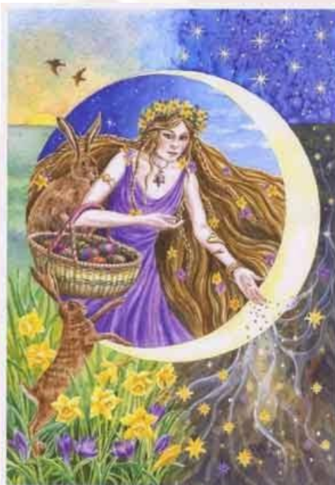
Deusa Eostern ou Ostara.

Antes dos judeus e dos cristãos, a mudança das estações do ano eram comemoradas através de rituais e cerimônias pagãs. Um desses rituais que tem muito a ver com a Páscoa, é o rito que cultua a deusa Eostern, também conhecida como Ostara, deusa da fertilidade, do amor e do renascimento. É realizado na celebração da entrada da primavera no Hemisfério Norte, conhecido como “Equinócio”. Alguns historiadores acreditam que o nome da Páscoa teve sua origem a partir do nome desta deusa, uma vez que o termo em inglês é “Easter” e o alemão é “Ostern”, sendo bem perceptível a semelhança com o nome da divindade.